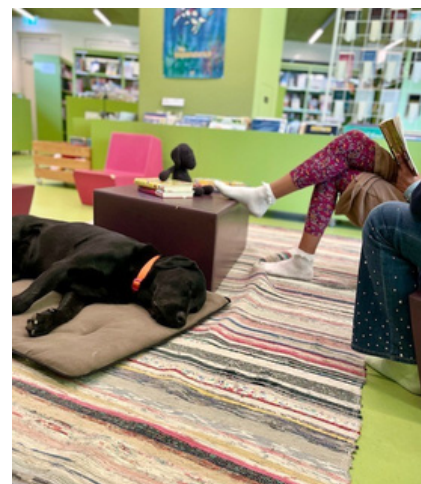
Lesehund Ilay bei der Arbeit