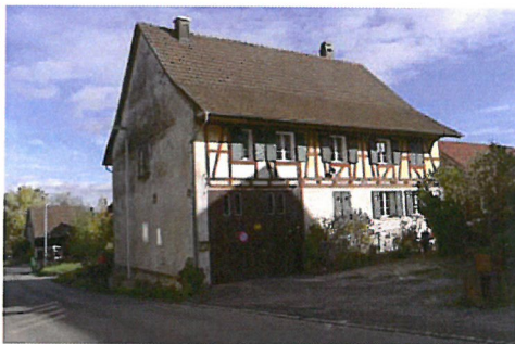
0100 Northwest- & Südwestfassade

Bautyp Landwirtschaftsbau - Vielweckbauernhaus