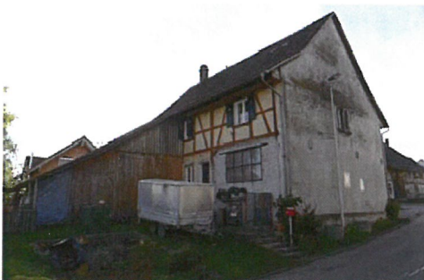
0101 Northwest- und Nordostfassade

Gut erhaltener ehem. Vielweckbau des mittleren 19. Jahrhunderts. Der Bau nimmt mit seiner an die Schmiedestrasse vorgerückten Stellung eine wichtige Position im Strassenbild ein, indem er einerseits den Strassenraum gliedert und andererseits mit dem benachbarten Haus Schmiedestrasse 2 einen kleinen Platz bildet.