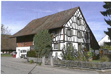
0114 Südost- und Südwestfassade