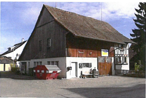
0113 Südwest- und Südostfassade

Bautyp Landwirtschaftsbau - Vielzweckbauernhaus