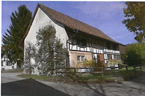
0116 Süd- und Ostfassade