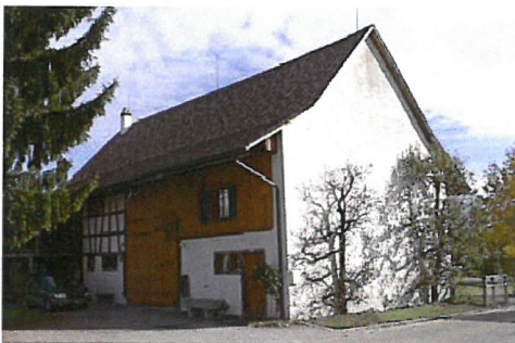
0115 West- und Südfassade

Bautyp Landwirtschaftsbau - Vielzweckbauernhaus