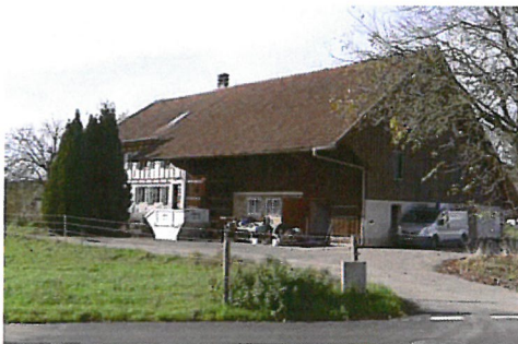
0126 Nordost- und Südostfassade

Bautyp Landwirtschaftsbau - Vielzweckbauernhaus