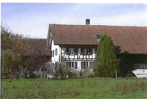
0127 Südwest- und Südostfassade

Der Bau liegt etwas ausserhalb des eigentlichen Ortskerns. Insbesondere die Fassaden nach Südosten und Südwesten prägen in der unverbauten Umgebung das Orts- und Landschaftsbild.