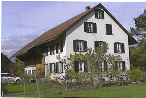
0154 Süd- und Ostfassade

Bautyp Landwirtschaftsbau - Vielzweckbauernhaus