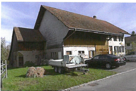
0155 West- und Südfassade

Vielzweckbauernhaus des späten 19. Jahrhunderts. Durch den allseitigen Verputz, das gerade Rafendach mit Kniewand und die grösseren Fenster unterscheidet sich der Bau von den Bauten aus dem früheren 19. Jahrhundert. Bauten aus dem späten 19. Jahrhundert in dieser zeittypischen Formensprache und in diesem guten Erhaltungszustand sind in Oberglatt selten. Zum guten Gesamteindruck trägt auch der Bauerngarten östlich des Hauses wesentlich bei.