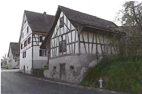
0172 Nord- und Westfassade

Die Nebengebäude zeugen von den wirtschaftlichen und sozialen Verhältnissen der jeweiligen Epoche. Heute stellen sie eine Bereicherung des Ortsbilds dar. Das Nebengebäude bei Dorfstrasse 4 besitzt auf Grund seiner Stellung direkt an der Dorfstrasse eine hohe Bedeutung im Ortsbild.