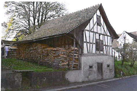
0170 Ost- und Nordfassade