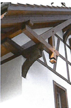
0185 Detail des alten Bugs mit der neuen Flugsparrenkonstruktion

Auf Grund dieser Veränderungen sind als Schutzziel vermutlich nur noch Stellung, Volumen und Firstrichtung zu nennen.