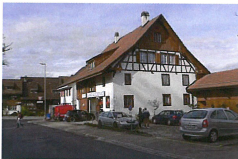
0183 Süd- und Ostfassade

Bautyp Landwirtschaftsbau - Vielzweckbauernhaus Bauzeit 1826 Architekt