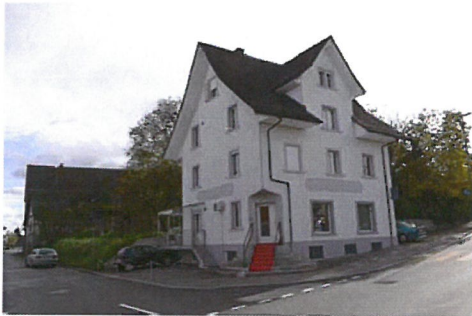
0188 Nord- und Westfassade

Bautyp Wohnbau - Wohn- und Geschäftshaus Bauzeit 1925 Architekt