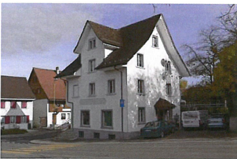
0219 West- und Südfassade

Wichtige Stellung im Ortsbild an der Kreuzung Bülachstrasse - Dorfstrasse.