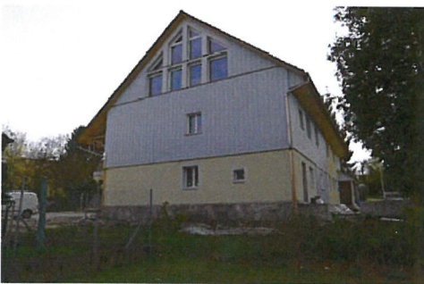
0216 Nordost- und Nordwestfassade

Das ehem. Vielzweckbauernhaus An der Halde 19 ist grösstenteils ein Neubau von 1936 nach einem Brandfall. Wichtige Bausubstanz ist nur noch minimal vorhanden, im Innern gar nicht mehr. Trotz dem Umbau und Ausbau 2012-2014 hat der Bau sein Erscheinungsbild als bäuerlicher Vielzweckbau erhalten können. In der leicht erhöhten Lage und in der Ecksituation An der Halde ist der Bau von Bedeutung für das Ortsbild in der Nahumgebung.