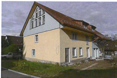
0226 Südwest- und -südostfassade

Bautyp Landwirtschaftsbau - Vielzweckbauernhaus