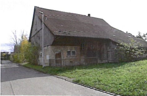
0229 Nord- und Westfassade