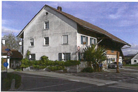
0053 Südwest- & Südostfassade

Bautyp Landwirtschaftsbau - Vielweckbauernhaus