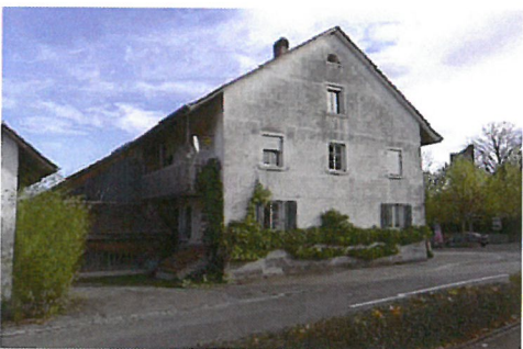
0052 Nordwest- und Südwestfassade

Schutzverfügung vom 22.10.1985, nur Strukturschutz.