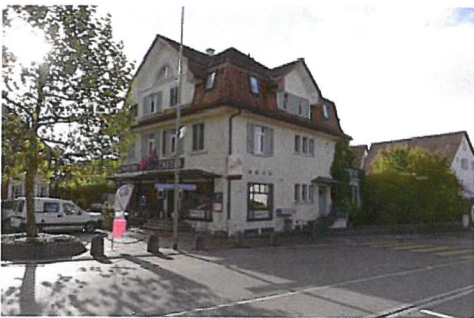
0059 Nordost- und Nordwestfassade

Schutzverfügung, revidiert am 08.08.1992.