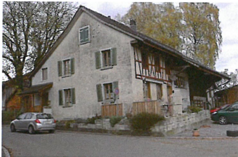
0285 Südost- und Südwestfassade

Bautyp Landwirtschaftsbau - Vielzweckbauernhaus