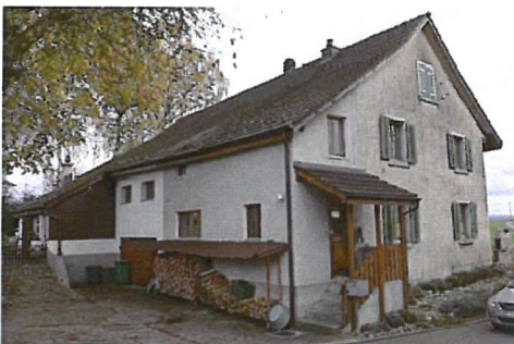
0286 Nordwest- und Südwestfassade

Ein Bau von relativ hoher Bedeutung im Ortsbild, der das Siedlungsgebiet im Nordosten der Grafenschaft abschliesst.