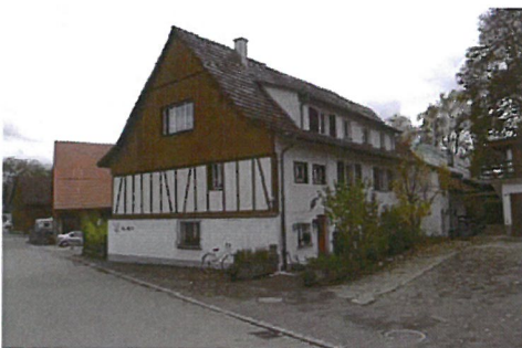
0257 Nordost- und Nordwestfassade

Das ehemalige Vielzweckbauernhaus hat durch die Umbauten zwischen 1965 und 1986 seine charakteristischen Eigenschaften verloren. Von Bedeutung ist heute wohl nur noch seine Stellung, Volumen und Firstrichtung. Ob noch ältere Bausubstanz vorhanden ist, liesse sich zu gegebenem Zeitpunkt durch eine Innenbegehung feststellen.