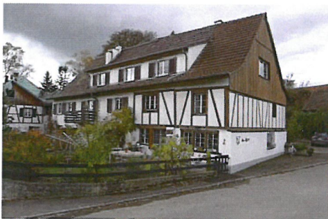
0249 Südost- und Nordostfassade

Bautyp Landwirtschaftsbau - Vielzweckbauernhaus