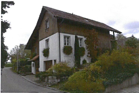
0242 Nordwest- und Südwestfassade