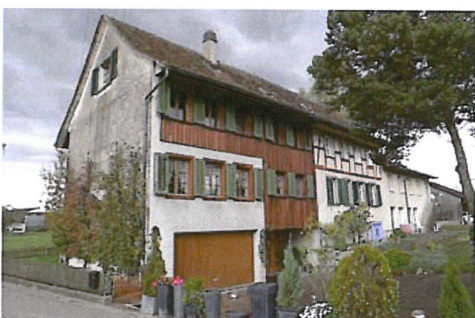
0256 Südwest- und Südostfassade

Das ehem. Vielzweckbauernhaus aus der ersten Hälfte des 19. Jahrhunderts hat durch den Umbau des Ökonomieteils wesentlich an Aussagekraft eingebüsst. In der wenig verbauten Umgebung, als einzigem Bauernhaus östlich der Strasse im Hof, ist dem Bau zumindest ein erhöhter Situationswert zuzusprechen.