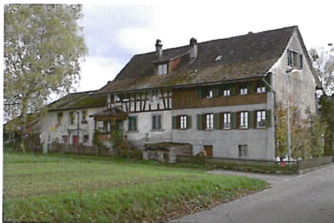
0255 Nordwest- und Südwestfassade

Bautyp Landwirtschaftsbau - Vielzweckbauernhaus