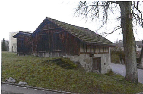
0328 Südost- und Nordostfassade