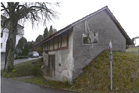
0329 Nordost- und Nordwestfassade

Zusammen mit dem Bauernhaus bildet der Bau den Auftakt in den bäuerlichen Kern der Siedlung von Hofstetten von Süden her, womit ihm ein erhöhter Situationswert zukommt.