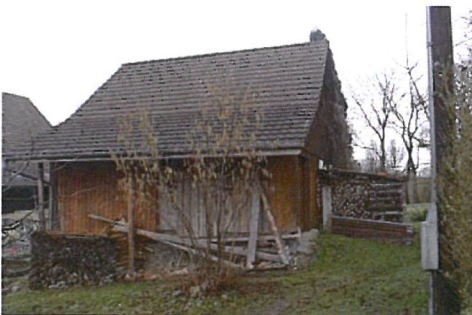
0342 Süd- und Ostfassade.

Bautyp Landwirtschaftsbau Bauzeit 18./19. Jh. Architekt