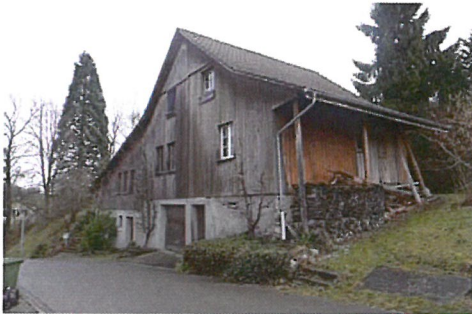
0341 West- und Südfassade