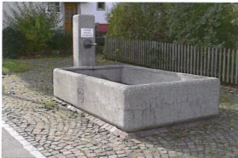
0195 Ansicht von Nordosten