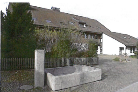
0196 Ansicht von Osten

Ein Brunnen ohne besondere künstlerische Bedeutung, dem als Dorfbrunnen nahe dem öffentlichen Furtacherhaus eine gewisse Bedeutung beigemessen werden kann.