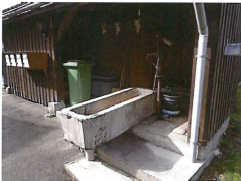
0427 Ansicht von Nordosten